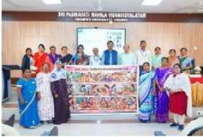
మదనపల్లి, ఫిబ్రవరి 17 (రాధే సింధూరం) మదనపల్లి సమీపంలో గల మిట్స్ (మదనపల్లి ఇన్స్టిట్యూట్ ఆఫ్ టెక్నాలజీ అండ్ సైన్స్) డీప్లీ టు బీ యూనివర్సిటీ ఇంటెలెక్చువల్ ప్రావర్సీ ఫెసిలిటీషన్ సెంటర్ (మిట్స్ - ఐ.ఐ.ఎస్.సి) వారు మరియు తిరుపతిలోని శ్రీ పద్మావతి